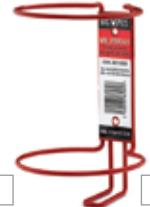
80 bak muurbeugel 2421