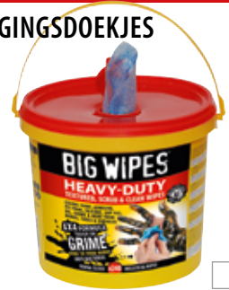
240 emmer 2427