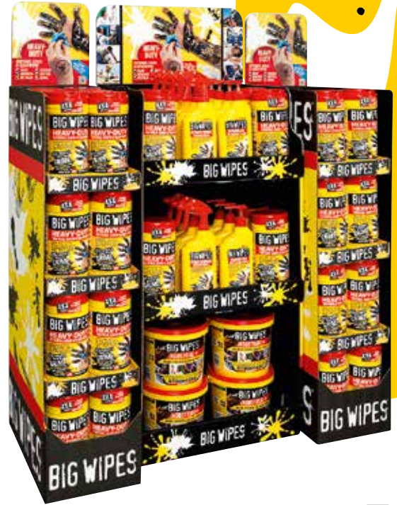
Freestanding Display Unit (FSDU) 32 x 80 baks